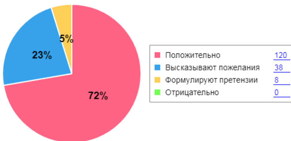
Как родители оценивают детский сад

Открытость и интегрированность дошкольного образовательного учреждения позволяют устанавливать и расширять партнерские связи. Дошкольное учреждение взаимодействует с объектами социального